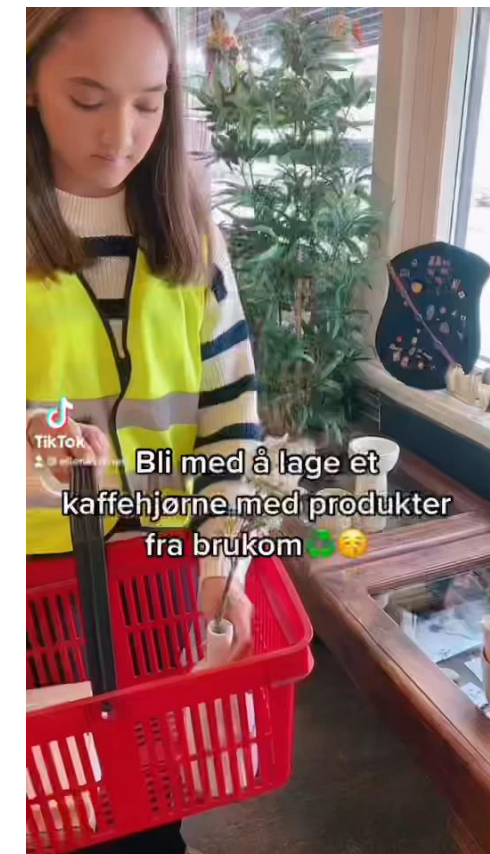
Bli med å lage et kaffehjørne med produkter fra brukom