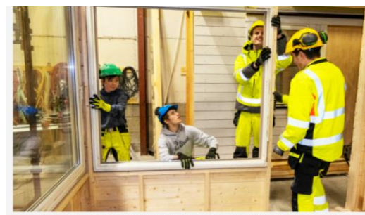
Yrkesfagelever lager drivhus av gamle vinduer